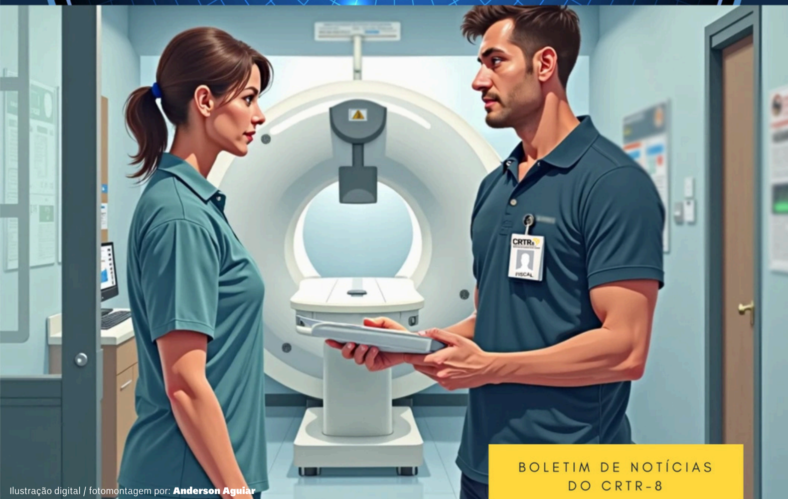
Ilustração digital / fotomontagem por: Anderson Aguiar